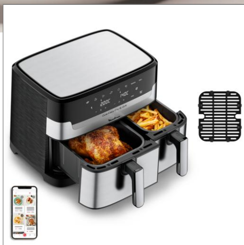
FRITEUSE A AIR DUAL EASY FRY & GRILL 8,3 L en acier inoxydable Friteuse à air Dual Easy Fry & Grill 8.3 L en acier inoxydable EZ905D20